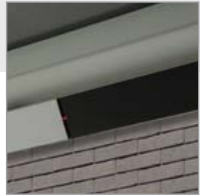
VERWARMING IN BEAM-MODULE