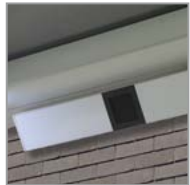
MUZIEK IN BEAM-MODULE